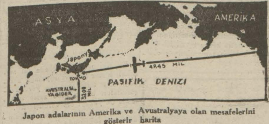
Japon adalarının Amerika ve Avustralyaya olan mesafelerini gösterir harita