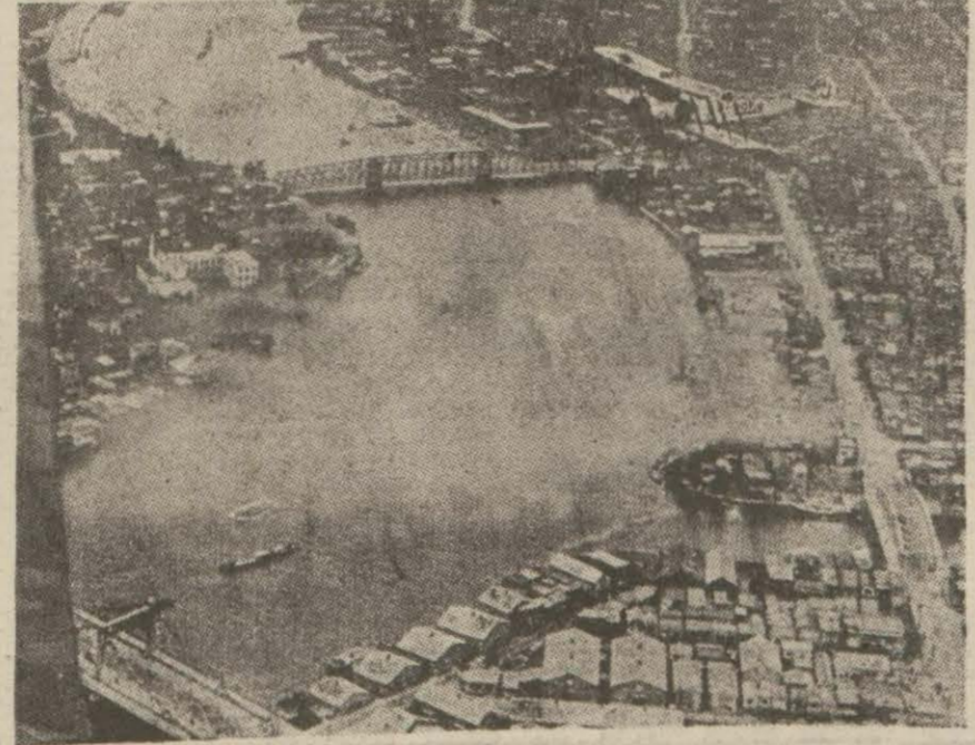
Tokyo'nun havadan görünüşü

Milli Şef Ankara 18 (Hususi) — Milli Şef İ. met İnönü, Devlet konservatuvarında Bethovenin ölümünün 115 inci yıld. nişimi münasebetle tertib edilen konserde, Büyük Millet Meclisi Reisi Abdülhalik Renda, Başvekâlî doktor Re. fik Saydam, kordiplomatik hazır bulunmuştur. Riyaseticümhur filârmonik orkestra, sile devlet konservatuvarı solistleri tarafından verilen bu konserde Bethovenin 9 uncu senfonisi çalınmıştır.